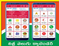
నిత్ర తెలుగు క్యాలెండర్